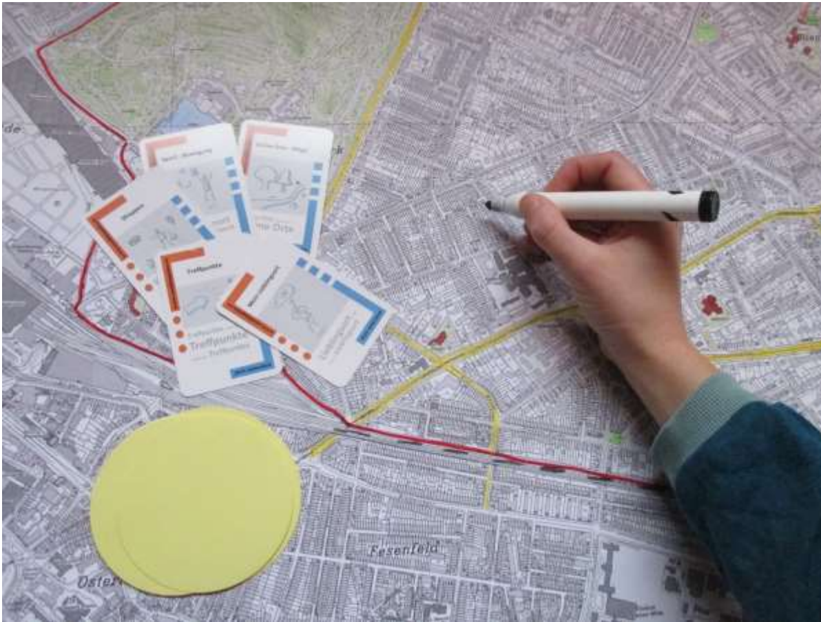
Stadtplan auf LKW Plane