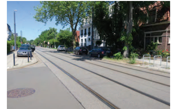
2. Blick aus der Fitgerstraße