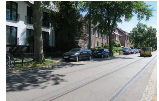
1. Blick von der Hartwigstraße