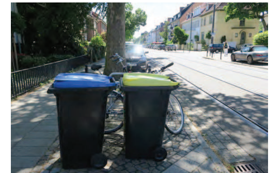
3. Blick vom Fußweg Hartwigstraße