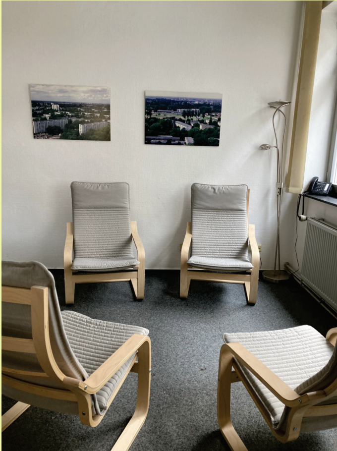
Sitzgruppe mit neuen Schwingsesseln im Schlichtungsraum im Bürgerzentrum Neue Vahr, 2022

Über unsere Arbeit informieren wir durch an einschlägigen Stellen ausliegende bzw. im Ortsteil verteilte Falblätter, vermittelt durch die Kontaktpolizei (durch den Hinweis auf unser Projekt bei Nachbarschaftskonflikten), im Gespräch mit Kooperationspartner:innen, auf Informationsveranstaltungen und Festivitäten im Stadtteil sowie über das Internet unter „ www.toa-bremen.de “.