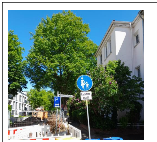
2) Bordenauer Ri. Loigny Radfahren erlaubt