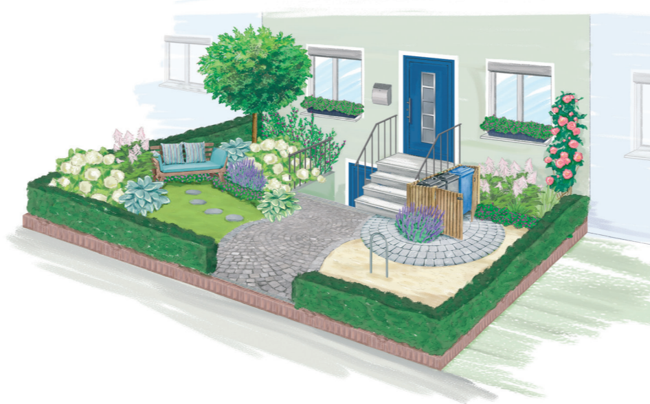
Ist der Vorgarten größer, lassen sich Tonnen verstecken und Fahrräder sicher anschließen