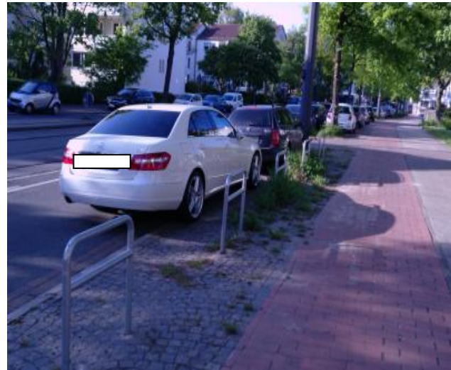
Fahrradbügel zugeparkt Crüsemannallee / Tramhaltestelle Busestr.