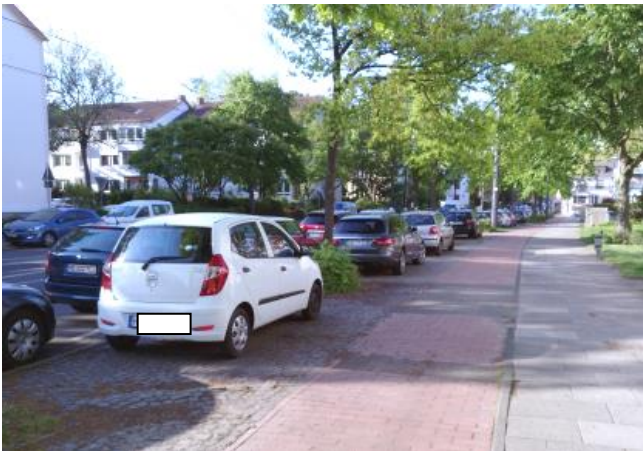
Parken in 2. Reihe HausNr. 39/41