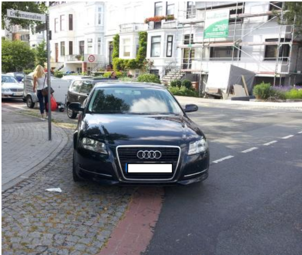
Crüsemannallee / Ecke Busestr.