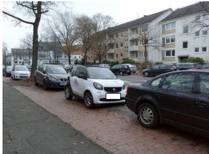
Parken vor HausNr. 40 Tramhaltestelle Busesstr.